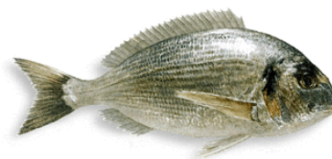
Figure 2: Orata (Sea bream)