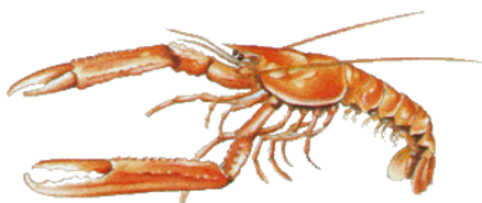
Figure 5: Scampo