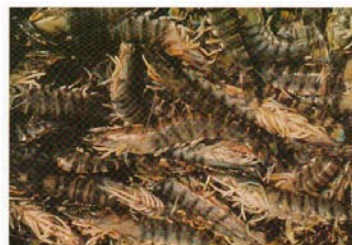
Foto 2 - Penaeus japonicus, la specie di gamberi più diffusamente allevata nell'area del Mediterraneo