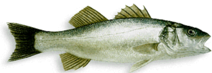
Figure 1: Spigola o Branzino (Sea bass)