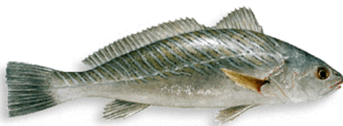
Figure 3: Ombrina (Shi drum or Corb)